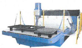
Bearbeitungszentrum BAZ 595D