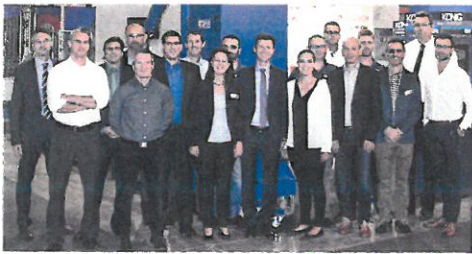
Beratung und Live-Vorführungen bietet das König/Schmieder-Team den Marmomac-Besuchern.

König/Schmieder hat auf der kommenden Marmomac den gleichen Standort wie im vergangenen Jahr (Halle 7, Stand F6). Das Unternehmen präsentiert auf der Messe verschiedene Werkzeuge und Verarbeitungslösungen. Einen Schwerpunkt bilden die Keramikbearbeitung sowie 45°-Verklebungen. Der König-Klebetisch für Kanten kann live vor Ort getestet werden.