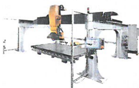
Brückensäge LDZ 2000